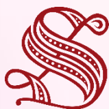
Senato della Repubblica

Il Premio "Ciò che Caino non sa", giunto alla VI edizione, si è già fregiato del patrocinio del Senato della Repubblica , della Camera dei Deputati , dell' Università degli Studi "Aldo Moro" di Bari , dell' Università degli Studi di Foggia e della Presidenza della Giunta Regionale della Puglia .